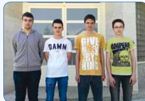
Vjeronaučni olimpijci – državno natjecanje