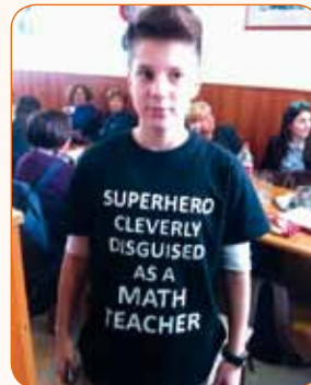
Projekt zamjene uloga (učenik – profesor)