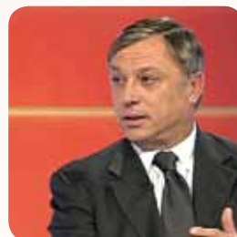
Zlatko Kranjčar , nogometaš