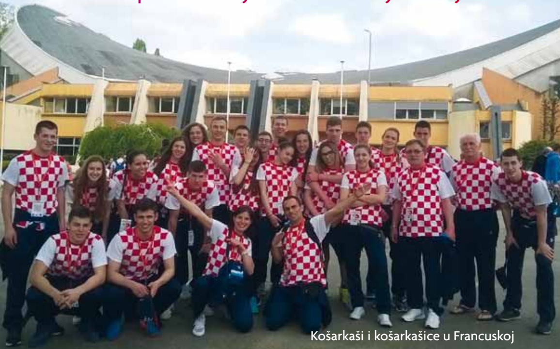
Košarkaši i košarkašice u Francuskoj