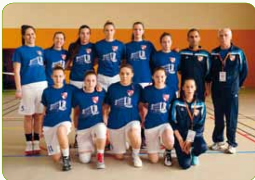
Košarkašice – osme na svijetu

Športaši nastavljaju svoje fantastične uspjehe: kao prvaci države naši košarkaši i košarkašice predstavili su Hrvatsku na Svjetskom školskom prvenstvu u Francuskoj. U konkurenciji 32 školskih ekipa iz cijeloga svijeta košarkašice su osvojile 8. mjesto, a košarkaši 10. Odličnim uspjehom na državnom natjecanju i naši su atletičari osigurali odlazak na Svjetsko školsko prvenstvo u Kinu.