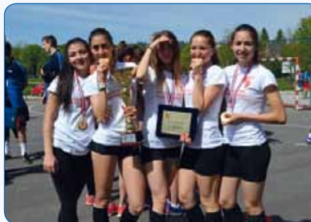
Ženska kros ekipa – ponovno državne prvakinje