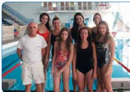
Plivačice – prvakinje Zagreba