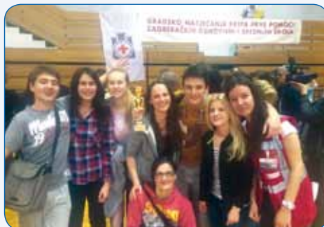
Ekipa Prve pomoći – najbolji u Zagrebu

Filmska kultura Novinarstvo Dramsko-scensko stvaralaštvo Nacionalna i kulturna baština Hortikultura Multimedija Web dizajn Debatni klub Hrvatska marijanska svetišta Biblijska povijest Humane vrednote i prva pomoć Zbor