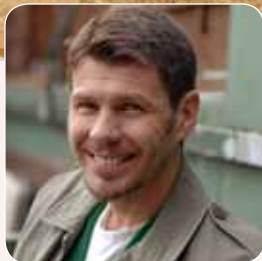
Zvonimir Boban, nogometaš