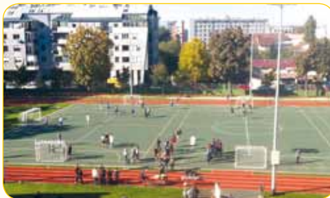
Novouređeni športski tereni za vrhunske rezultate

Kao prvi strani jezik uči se engleski, a kao drugi strani jezik njemački, talijanski ili francuski.