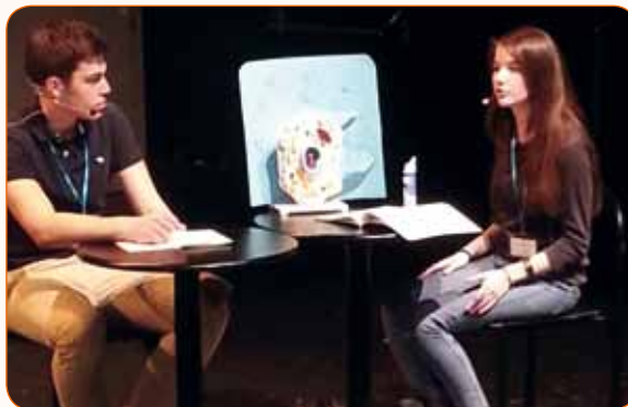
Završnica natjecanja Školski laboratorij 2015.