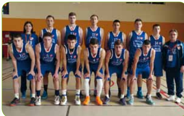
Košarkaši – deseti na svijetu