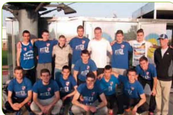
Atletičari – ponovno na državnom natjecanju