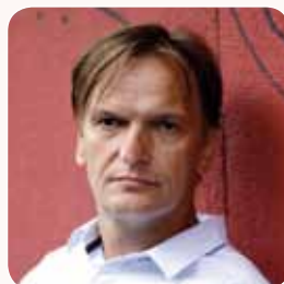
Vili Matula , glumac