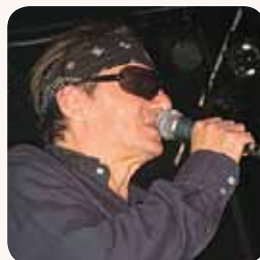
Jura Stublić , glazbenik