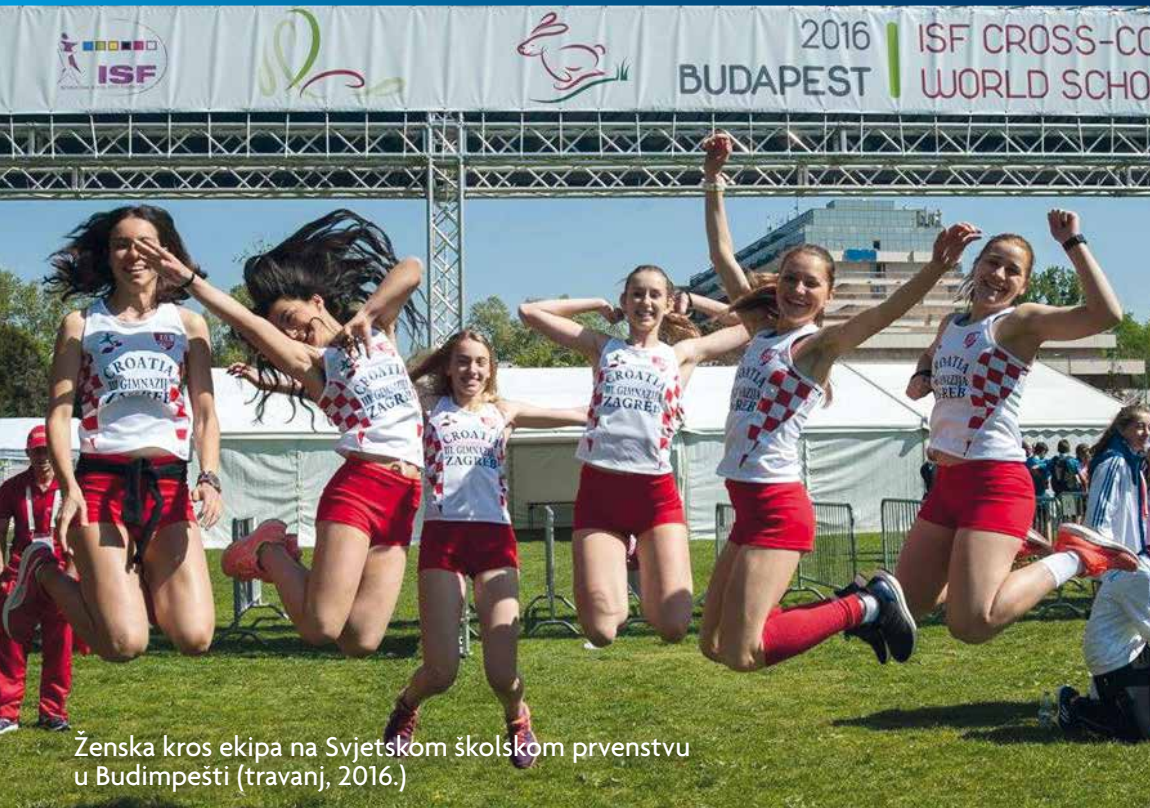
Ženska kros ekipa na Svjetskom školskom prvenstvu u Budimpešti (travanj, 2016.)

Četiri športske ekipe na svjetskim prvenstvima