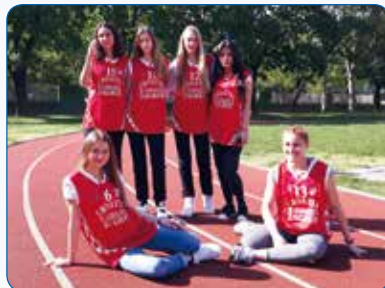
Ženska kros ekipa – prvakinja na krosu Sportskih novosti i državne prvakinja