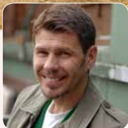
Zvonimir Boban, nogometaš