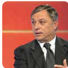
Zlatko Kranjčar , nogometaš