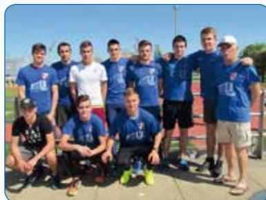
Atletičari – drugo mjesto u Gradu