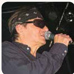
Jura Stublić , glazbenik