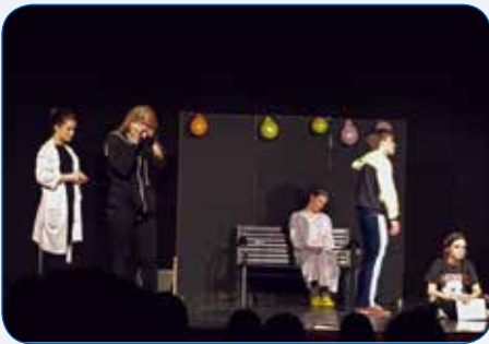
Dramska skupina s predstavom Reces i ja na državnoj smotri LiDraNo 2016.