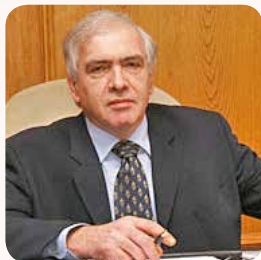
Željko Rohatinski , guverner HNB-a