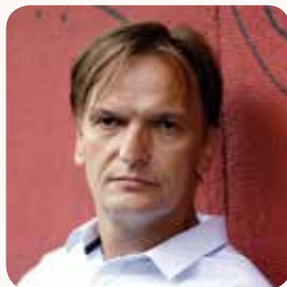
Vili Matula , glumac