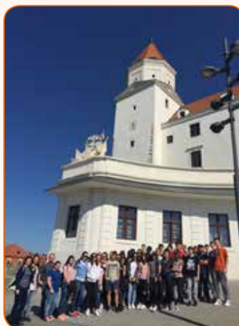
Prvi razredi u Bratislavi.