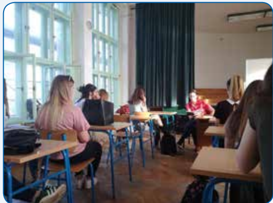
Noć knjige – u vođenoj raspravi učenici su promišljali o budućnosti knjige.