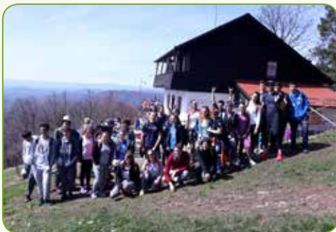
Planinari osvojili Japetič...