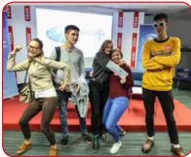
Euroscola – natjecanje u znanju o Europskoj uniji.