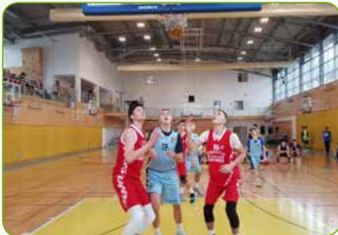
Na košarkaškom turniru u Ljubljani.