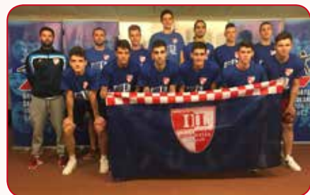
Srebrni u državi – muška košarkaška ekipa.