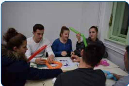
I matematika može biti kreativna – dokazali smo na Večeri matematike...