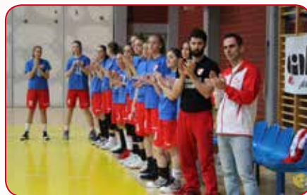
Košarkašice – srebrne u Gradu.