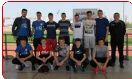
Atletičari – drugi u Zagrebu.