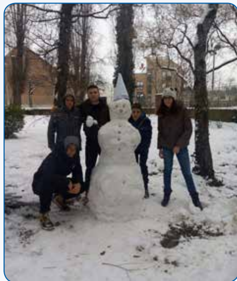
...i radeći snjegoviče u školskom dvorištu.