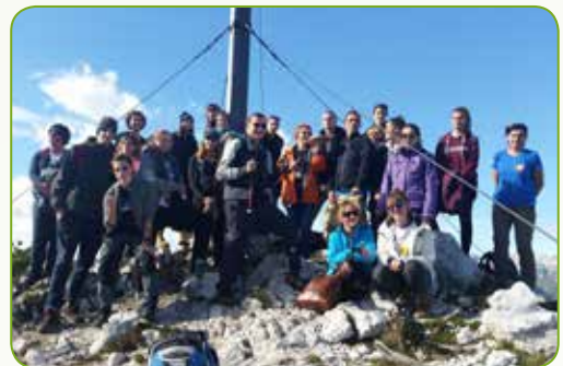
...i Vogel u Sloveniji.