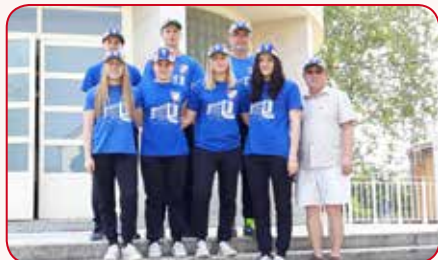
Ekipa plivačica i atletičara na Gimnazijadi.

Srbija, 2018. – dvije naše ekipe, muška i ženska, natjecat će se na Svjetskom prvenstvu u haklu.