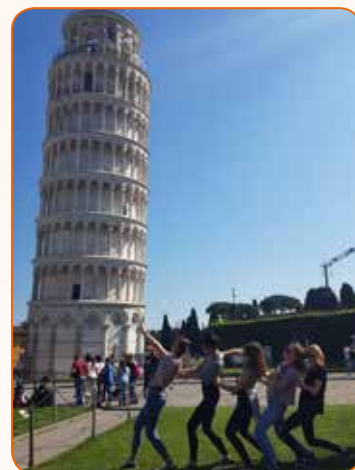
Drugi razredi u Pisi.