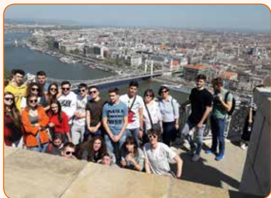
Nagradni slobodni dan za najbolji razred IV. f iskoristio je za izlet u Budimpeštu.