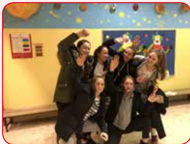
Naša ekipa na županijskom natjecanju iz Prve pomoći.