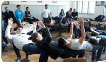
Energizing radionica u sklopu Sajma zdravlja.